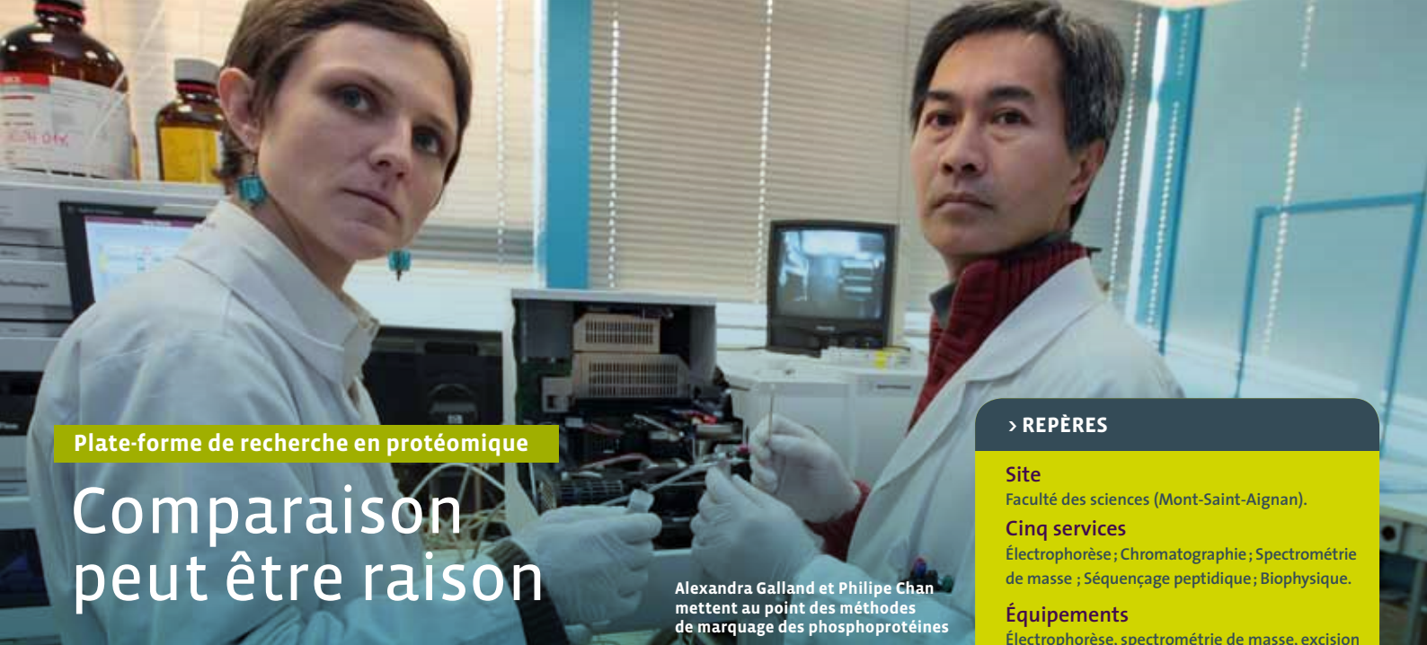
Plate-forme de recherche en protéomique