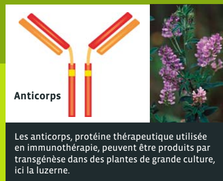
Les anticorps, protéine thérapeutique utilisée en immunothérapie, peuvent être produits par transgénèse dans des plantes de grande culture, ici la luzerne.

tables usines cellulaires, peuvent synthétiser des protéines recombinantes complexes, notamment des anticorps, exemptes de contaminations par agents pathogènes chez l'homme. Mais voilà, produire des protéines thérapeutiques dans des plantes transgéniques se heurte à un obstacle : la différence entre les processus de glycosylation des protéines existant chez les mammifères et les plantes. Le laboratoire travaille donc à rendre ces protéines issues de la transgénèse végétale identiques à celles qui sont produites dans l'organisme humain, soit « humaniser » les molécules