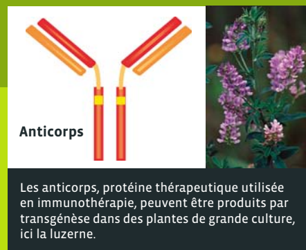
Les anticorps, protéine thérapeutique utilisée en immunothérapie, peuvent être produits par transgénèse dans des plantes de grande culture, ici la luzerne.

tables usines cellulaires, peuvent synthétiser des protéines recombinantes complexes, notamment des anticorps, exemptes de contaminations par agents pathogènes chez l'homme. Mais voilà, produire des protéines thérapeutiques dans des plantes transgéniques se heurte à un obstacle : la différence entre les processus de glycosylation des protéines existant chez les mammifères et les plantes. Le laboratoire travaille donc à rendre ces protéines issues de la transgénèse végétale identiques à celles qui sont produites dans l'organisme humain, soit « humaniser » les molécules